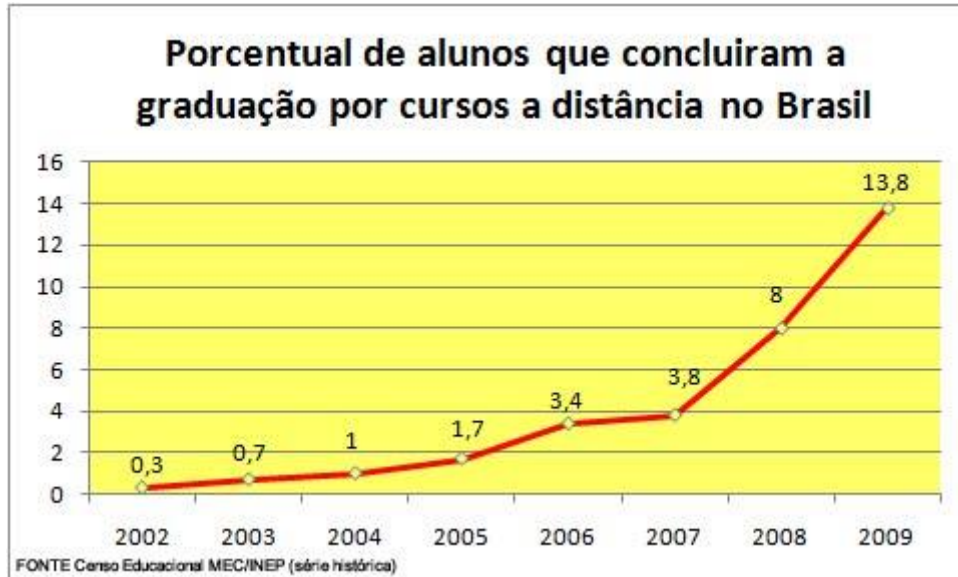
Gráfico 2 – Concluintes de graduação a distância (em % do total de concluintes)

Na comparação entre as metodologias presencial e a distância, muitos especialistas consideram que a tendência não é a substituição de um grupo pelo outro, e nem mesmo a divisão clara entre os dois tipos de metodologias de ensino. É mais provável que haja uma fusão entre os dois tipos, de modo que fique cada vez mais difícil distinguir uma metodologia da outra. Desde a década passada, vem crescendo o número de matérias das grades curriculares que são rotineiramente cursadas a distância. Esta geração que entra nos cursos de graduação chega destituída de alguns preconceitos e munida de cada vez mais instrumentos para a prática da EAD.