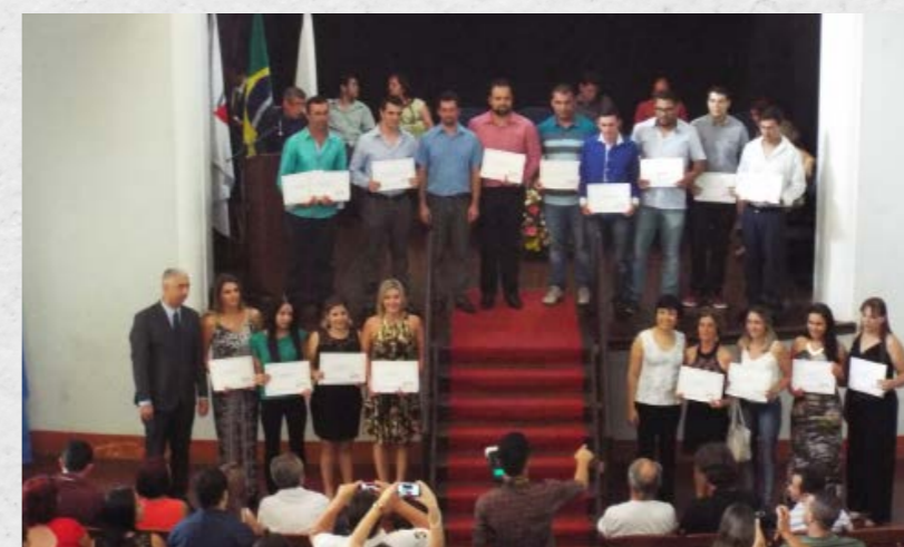
1ª Turma de Licenciatura em Matemática (2015)

Se você tem interesse em fazer um de nossos cursos, fique atento ao nosso site e redes sociais para se atualizar sobre possíveis aberturas de editais.