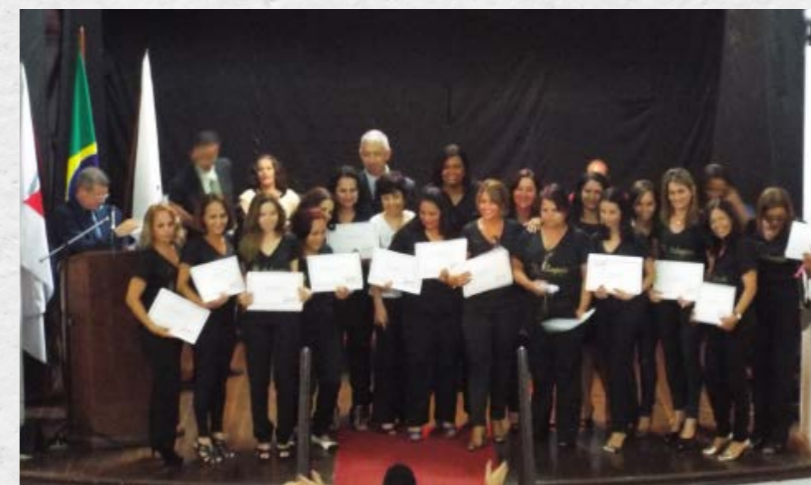
1ª Turma de Licenciatura em Pedagogia (2015)

As cerimônias de colação de grau (Cursos de Graduação) acontecem no Campus Santo Antônio, no mesmo período em que os alunos dos cursos presenciais realizam a cerimônia.